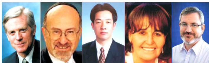
从左至右为加拿大前议员大卫·乔高；北美团长鲁文·鲍克；亚洲团长赖清德；欧洲团长卡罗琳·考克斯；澳洲团长安德鲁·巴列特

【明慧网】关注法轮功人权状况的国际性组织“法轮功受迫害真相联合调查团 (CIPFG)”与独立调查员、加拿大前国会议员大卫·乔高，日前致函中国国家主席胡锦涛和国务院总理温家宝，希望他们能在未来两月内结束对法轮功群体和高智晟律师等良心人士的迫害，指出奥运会和属“反人类罪”的迫害在中国同时进行将是全人类的耻辱。