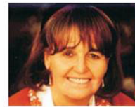
Baroness Caroline Cox