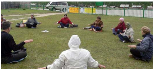
▲小村法轮功学员户外炼功