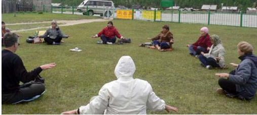
▲小村法轮功学员户外炼功