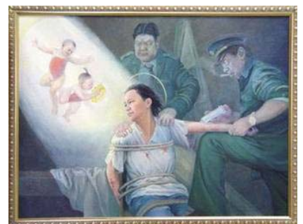
画展作品：光明与黑暗

真善忍国际美展的作品是由来自不同背景、卓有成就的艺术家所创作。九天的画展期间，参观者络绎不绝。每幅画作都在向参观者讲述着法轮功真相，每位参观者都从