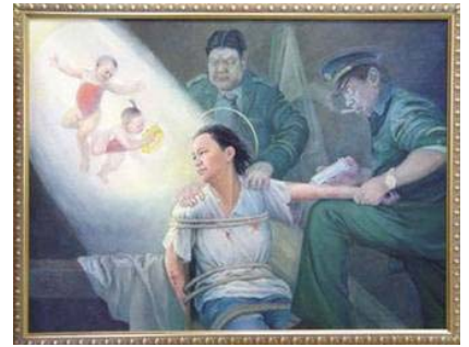
画展作品：光明与黑暗

真善忍国际美展的作品是由来自不同背景、卓有成就的艺术家所创作。九天的画展期间，参观者络绎不绝。每幅画作都在向参观者讲述着法轮功真相，每位参观者都从