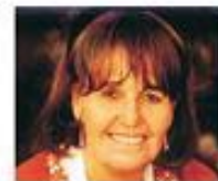
Baroness Caroline Cox