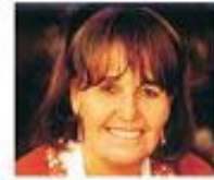
Baroness Caroline Cox