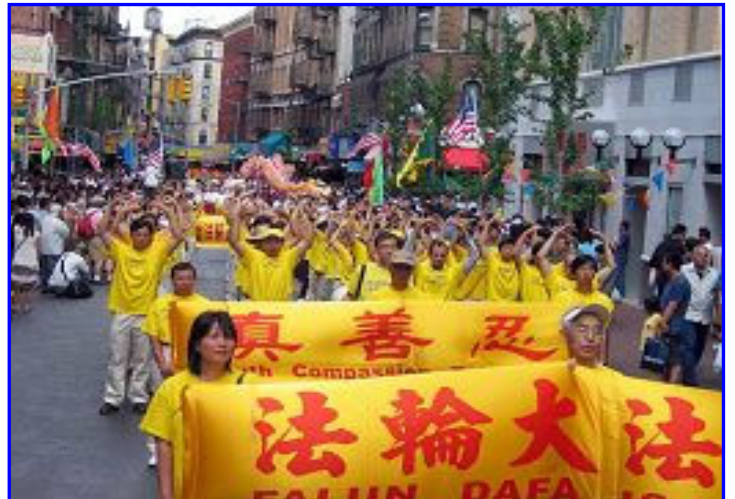
图片新闻 二零零七年七月一日中午，纽约华埠举行庆祝独立日大游行，多个中西团体派队参加。阵容壮观的法轮功队伍再展风采，华人从心里佩服，双手竖大拇指，赞“法轮功了不起”。

上显现了，是我女儿之福，是我们全家之福！我们全家发自内心的感谢李洪志师父，感谢法轮大法！我们决定以后要诚心诚意修炼法轮大法。不论何时何地，我们心中永远有大法，法轮大法好！