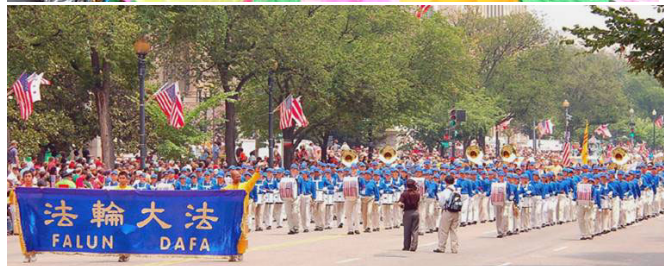
▲法轮功学员的精美花车和气势恢宏的“天国乐团”