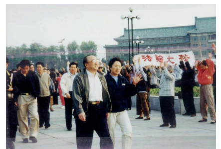
图为 98 年 5 月 15 日伍绍祖亲赴法轮功发祥地长春考察。

据中国协和医科大学副教授但凌等 11 位专家对北京市 12731 名法轮功学员的调查表明，其治病有效率达 99.1%；98 年 9 月，国家体育总局对广州等 10 个市约 1.25 万名法轮功学员就身心健康进行全面调查，祛病健身率达 97.9%。至 98 年，上海东方电视台统计中国有一亿人修炼法轮功。98 年下半年，以乔石为领导的全国人大组织详细调查，得出结论：法轮功于国于民有百利而无一害。◇