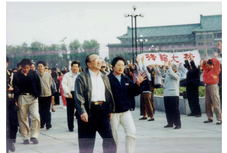
图为 98 年 5 月 15 日伍绍祖亲赴法轮功发祥地长春考察。

据中国协和医科大学副教授但凌等 11 位专家对北京市 12731 名法轮功学员的调查表明，其治病有效率达 99.1%；98 年 9 月，国家体育总局对广州等 10 个市约 1.25 万名法轮功学员就身心健康进行全面调查，祛病健身率达 97.9%。至 98 年，上海东方电视台统计中国有一亿人修炼法轮功。98 年下半年，以乔石为领导的全国人大组织详细调查，得出结论：法轮功于国于民有百利而无一害。◇