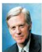
Hon. David Kilgour