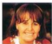
Baroness Caroline Cox