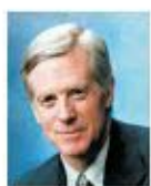
Hon. David Kilgour

图：加拿大前国会议员大卫·乔高（上左）和“法轮功受迫害真相联合调查团”（CIFPG）四大分团团长：北美团长鲁文·鲍克，犹太领袖及学者，加拿大东部肾脏基金会器官捐赠委员会主席（上中）；亚洲团长赖清德，台湾立法委员（上右）；欧洲团长卡罗琳·考克斯，英国上议院议员（下左）；澳洲团长安德鲁·巴列特，澳大利亚国会参议员（下右）