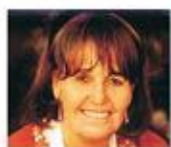
Baroness Caroline Cox