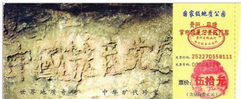
▲图为藏字石风景区门票。二零零二年六月，在贵州省平塘县掌布乡发现了距今 2.7 亿年的藏字石，自然形成的巨石断面上，惊现“中国共产党亡”六个大字，昭示着“天灭中共”的天象。

他又看了相关的真相资料，明白了“三退”原来是给每个人的生命得救的机会。最后他说：“给我退了那个邪党吧！”◇