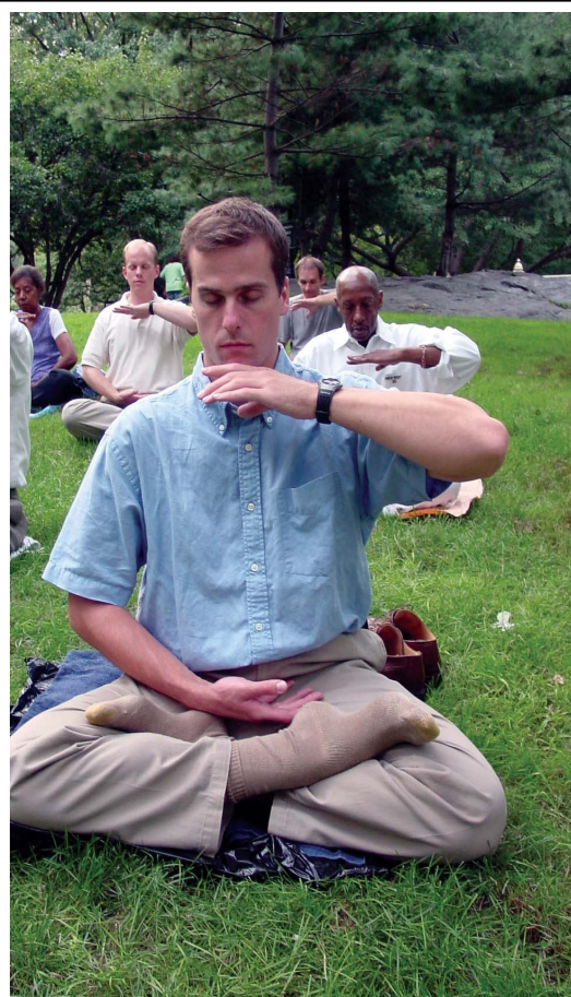
图为纽约法轮功学员在炼第五套功法。