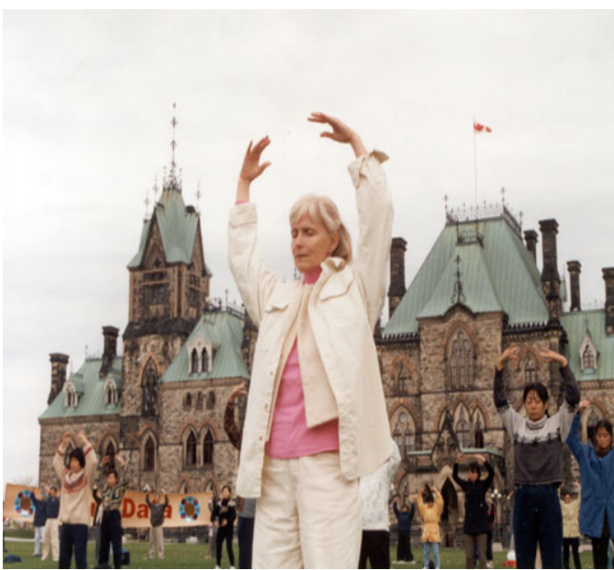
多伦多学员在炼功 加拿大多伦多