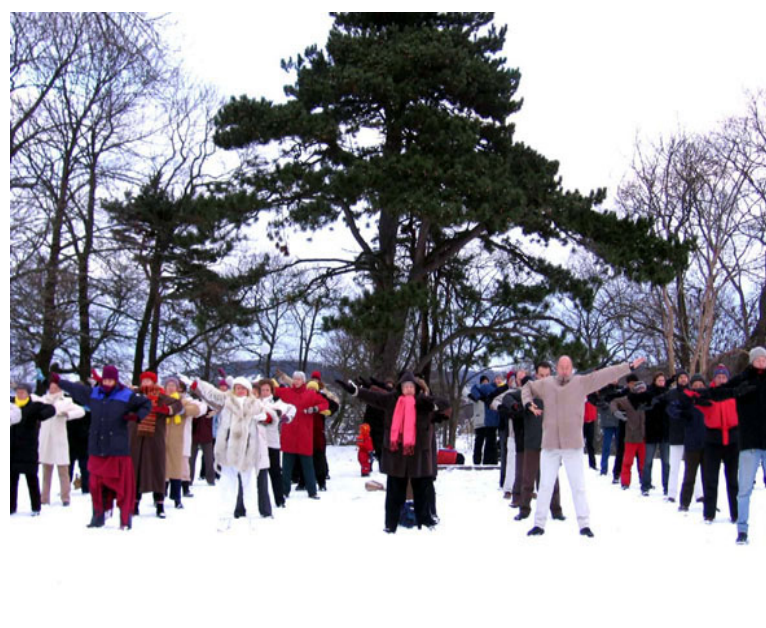
北欧法轮功学员在瑞典哥德堡集体炼功

法轮大法自传出以来，在全世界吸引了上亿有志有识之士，深得各国各界的一致好评，以下是近年来国际社会鉴于李洪志老师和法轮大法对人类身心健康作出的杰出贡献而颁发的奖励：各界褒奖(1461) 支持议案(265) 支持信函(1140) ，其中支持议案之一来自联合国协会世界联盟。