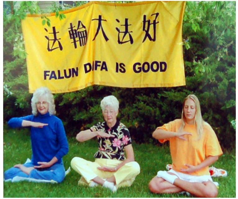
法轮功学员一家三代炼功照获奖, 图为道蒂 女士、女儿、外孙女一起炼法轮功