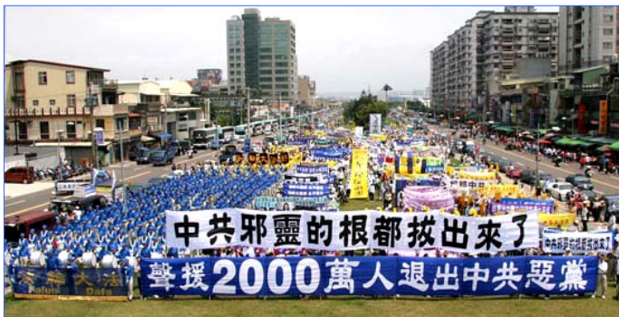
全球声援两千万人退出中共的大型活动已覆盖北美、欧洲及亚洲等十多个国家，声势浩大。图为四月十五日，近四千民众在台湾举行大游行，声援退党潮。

** 如果在 1991 年 8 月之前要是有人说苏共很快要垮台，人们一定会说这人是疯子。然而同年的 8 月 19 日，这个世界上最强大的共产党政权，在几天之间就被解体，震惊了世界。