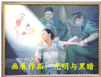
画展作品：光明与黑暗

许多都灵市民在参观完画展后都在问，为什么中共如此对待这些好人？中共一定是太惧怕这些有着无畏勇气的人们了，所以才失去了理智。