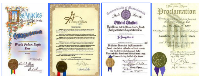
第八届世界法轮大法日期间，美、加各级政府发来贺状六十余份，褒奖法轮大法。

“第八届世界法轮大法日”期间，加、美、澳等国政要纷纷致函祝贺世界法轮大法日、褒奖法轮大法。加拿大总理蒂文·哈珀在给法轮功学员的贺信中，向为国家多元化做出贡献的众多法轮功学员表达诚挚的祝福。美国新墨西哥州州长在褒奖状中写到：法轮大法是一种古老的包括动功和打坐的自我修炼系统，强调同化宇宙原理“真、善、忍”；法轮大法不是宗教，也不搞政治，然而一些学员却受到迫害和镇压，成千上万的学员不经审讯就被关进监狱和劳教所……。新墨西哥州州长比尔·理查德逊，宣布零七年五月十三日为整个新墨西哥州的“法轮大法日”。