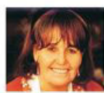
Baroness Caroline Cox