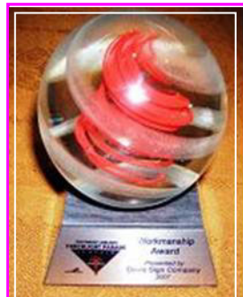
法轮功「大法船」花车荣获最佳「制造工艺」奖

【明慧网】第五十八届“海洋节炬光游行”于七月二十八日晚在西雅图市中心的大道上举行。在现场三十万观众的欢呼声中，在电视机前七十万观众的期待中，法轮功队伍以气势磅礴的二百人阵容，展现了从现代西方文明到东方神传文化、从人间至天国的美好景象。法轮功浩浩荡荡的“天国乐团”令人赞叹不已；恢宏精美的“大法船”更令人叹为观止。电视七台评论员向观众介绍时说，“这是从古老庄严的唐朝直接驶来的法轮功‘大法船’花车。她获得了今年的最佳‘制造工艺’，非常绚丽多彩，具有非常的想象力！”◇