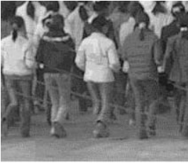
图2、3说明：室外的“军训”队列（拼合示意，由出所的学员见证）。站军姿、三大步法（齐步，正步，跑步），任何一个动作都被它们变成一种迫害方式。强制穿劳教服，戴“学员牌”每个大法弟子的左右都是“包控”，一举一动都被包控监管强制。恶警

图1说明：部分小监“军训”（下蹲、站军姿），在隔离的状态下恶警和一群吸毒帮教（也叫“包控”）迫害法轮功学员的一种方式，数小时强迫学员一动不动保持某种姿势，若有反抗或动作变形，便是毒打；毒打后继续进行，或换一种动作继续。白天黑夜，数天如此。