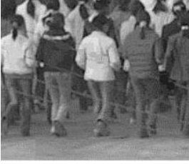
图2、3说明：室外的“军训”队列（拼合示意，由出所的学员见证）。站军姿、三大步法（齐步，正步，跑步），任何一个动作都被它们变成一种迫害方式。强制穿劳教服，戴“学员牌”每个大法弟子的左右都是“包控”，一举一动都被包控监管强制。恶警

图1说明：部分小监“军训”（下蹲、站军姿），在隔离的状态下恶警和一群吸毒帮教（也叫“包控”）迫害法轮功学员的一种方式，数小时强迫学员一动不动保持某种姿势，若有反抗或动作变形，便是毒打；毒打后继续进行，或换一种动作继续。白天黑夜，数天如此。