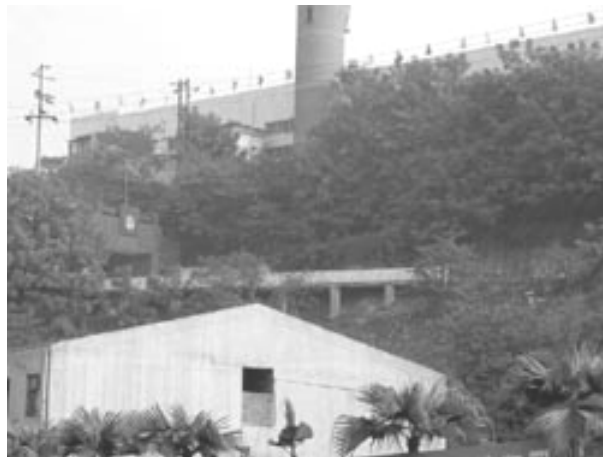
重庆女子劳教所位于茅家山的旧址