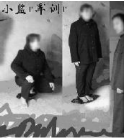
图1说明：部分小监“军训”（下蹲、站军姿），在隔离的状态下恶警和一群吸毒帮教（也叫“包控”）迫害法轮功学员的一种方式，数小时强迫学员一动不动保持某种姿势，若有反抗或动作变形，便是毒打；毒打后继续进行，或换一种动作继续。白天黑夜，数天如此。