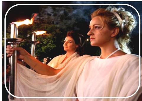
象征自由、和平和正义的古希腊女神装束的白衣女子点燃圣火

“人权圣火”活动得到了雅典民众的热心支持，也引起了北美、亚洲、欧洲许多媒体的关注。◇