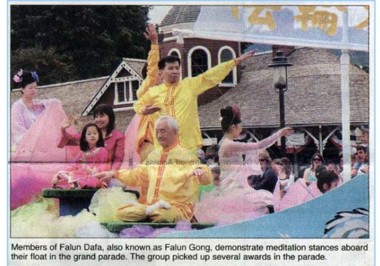
Members of Falun Dafa, also known as Falun Gong, demonstrate meditation stances aboard their float in the grand parade. The group picked up several awards in the parade.

美国华盛顿州《斯诺阔米山谷报》八月八日刊登了法轮功学员参加当地“铁路日”节游行的照片，报道说：