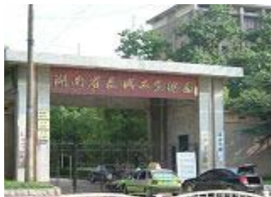
“湖南省长兴工业总厂”大门即是女子监狱大门之一

【明慧网】湖南（长沙）女子监狱位于长沙市香樟路中段。该监狱对外称“省级文明监狱”，而实际上，仅在对法轮功学员的迫害中，该监狱出现多起违法行为。