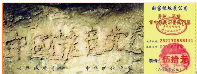
▲掌布风景区门票上“中国共产党亡”的照片

在贵州平塘县掌布风景区发现了一块二亿七千万年前的藏字石，这块石头自高崖坠地后，一分为二。二零零二年六月被当地村民发现藏字，藏字可辨有六个大字“中国共产党亡”，这是国内一百多家媒体包括新华社、中央台等，都有过报导和专题，网上也能搜索到相关照片。当然，他们都不敢报最后一个字。经专家鉴定，这些字都是天然形成的，从概率来讲是“不可能事件”。人们当前的热门话题，议论最多的是贪官、人心