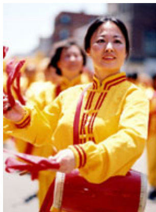
法轮功学员在社区游行中表演腰鼓

“因为法轮功能够使人身体健康、精神受益，所以炼功者日益增多。据统计，到一九九九年，中国国内有近一亿人在学炼法轮功，其数字远远超过中共党员的人数，这便引起了中共的极度恐慌。一九九九年七月二十日，当时中共领导人江泽民在其个人嫉妒心的驱使下，不顾百姓的