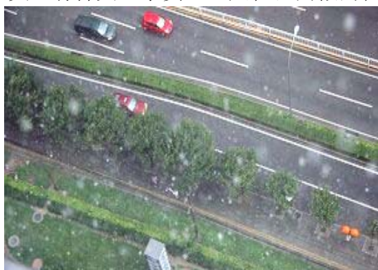
▲八月六日，北京海淀区成府路地区，风卷着雪花从天而降。

中共制造的这场旷世奇冤，已持续了八年多，而且罪恶还在继续着，怎能不让天地震怒？古人说：三尺头上有神灵。事实上，人在世间做的任何事情都会有果报。京城六月飞雪，谁能说不是上天的慈悲警示呢？