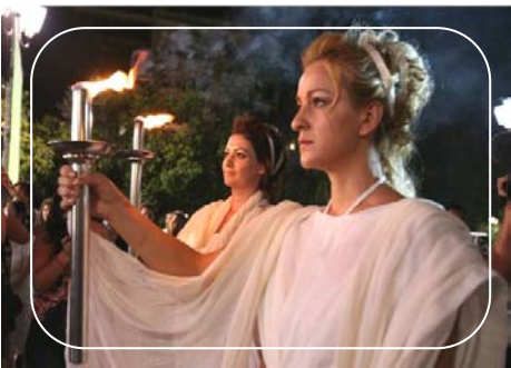
人权圣火在希腊雅典被点燃

【明慧网】二零零七年八月九日晚，在位于希腊国会前、雅典市中心的宪法广场上，来自欧美亚澳四大洲的“法轮功受迫害真相联合调查团（CIPFG）各界代