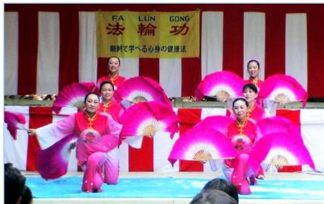
▲ 法轮功学员表演的中国民族舞蹈扇子舞

【明慧网】夏日节是日本町田市每年夏天都举行的一项大型传统活动，市长和市议长都到场致词。二零零七年八月二十五日，法轮功学员参加了夏日节的舞台演出，展示了中国传统文化的风采，更为当地市民带来了大法的祥和美好，观众报以热烈的掌声。