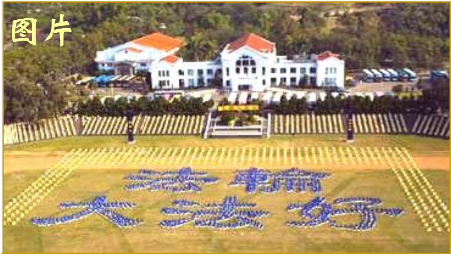
▲零七年十二月一日，约四千名台湾法轮功学员在台湾南投县中兴新村，排字“法轮大法好”。