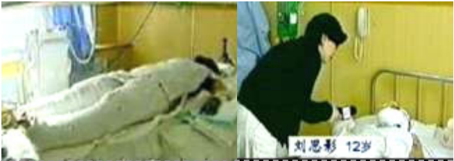
央视《焦点访谈》中的“自焚者”被包裹得严密。 气管切开后还能说唱？记者采访不穿防护服不戴口罩。

CCTV《焦点访谈》说警察“不到一分钟”，就“迅速扑灭了火焰”，那么一分钟内数十个灭火器和灭火毯是从哪弄来的？