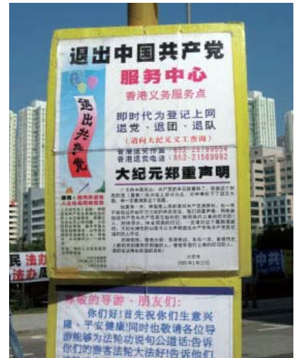
▲香港景点上的退党服务中心

愿你早醒悟，为何来世间， 愿你记起来时愿 早日结善缘。 等了一世又一世，盼了一年又一年， 愿你早日明真相，大法已在传。 愿你早日明真相，有缘再相见。◇