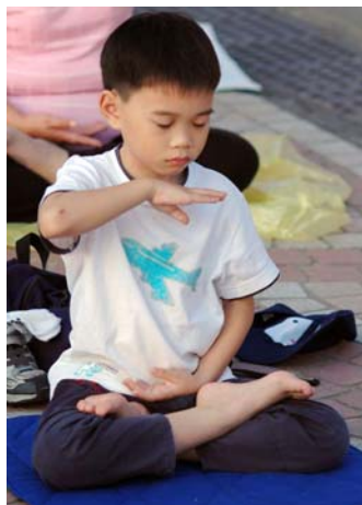
▲台湾修炼法轮功的小弟子炼功身影