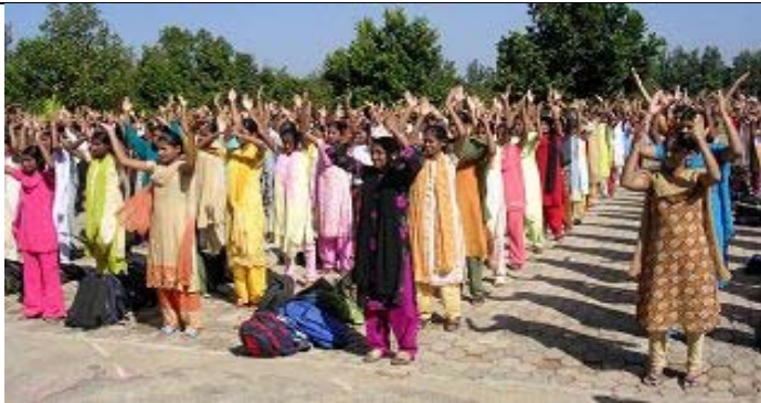
Sri Adichunchanagiri Mahasamsthama moth 学校的学生学炼法轮功