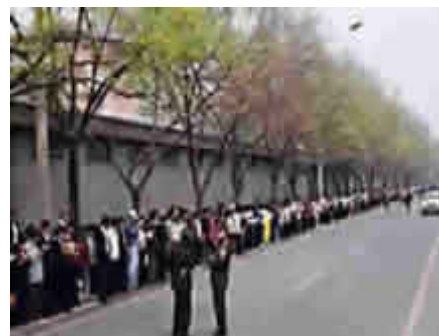
“4.25”事件现场,法轮功学员秩序井然。

多行不义必自毙。天津市多名参与迫害法轮功的邪恶之徒均已遭受恶报。除了张立昌之外,天津市原政法委书记、市公安局局长、政协主席宋平顺自杀身亡;原天津市人民检察院检察长、市委政法委副书记李宝金和原天津市公安局局长武长顺被双规。这几个恶徒迫害法轮功的累累罪行记录在“追查迫害法轮功国际组织”的网站上。◇