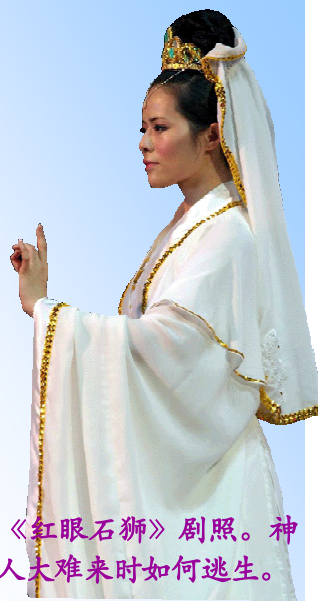
神韵晚会《红眼石狮》剧照。神告诉善良人大难来时如何逃生。