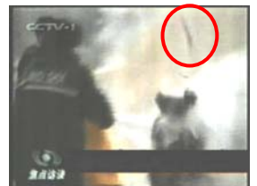
2、击打后飞出的重物