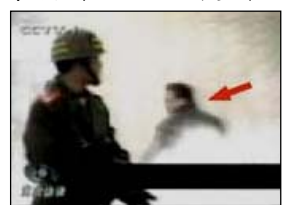
4、击打者仍保持用力姿势