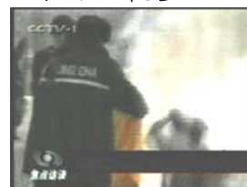
3、手摸被打后的头部