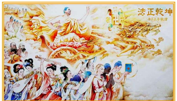
绘画欣赏《法正乾坤》 （局部）——巡回四十多个国家的“真善忍国际美展”日前在台湾展出，