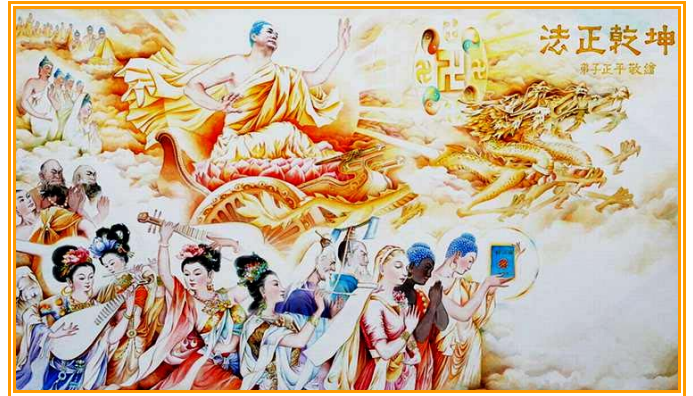
绘画欣赏《法正乾坤》 （局部）——巡回四十多个国家的“真善忍国际美展”日前在台湾展出，

和感谢。山姆希望世界每个角落的人都能有幸欣赏到神韵纯善、纯美的真正中国传统文化。他说：神韵是送给整个世界的最珍贵的礼物。