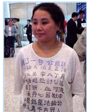
2000 年 11 月 30 日章翠英从大陆监狱返澳

目前，江泽民因迫害法轮功，在全球十五个国家被起诉，被控以“反人类罪”、“酷刑罪”等，在全世界引起极大反响。