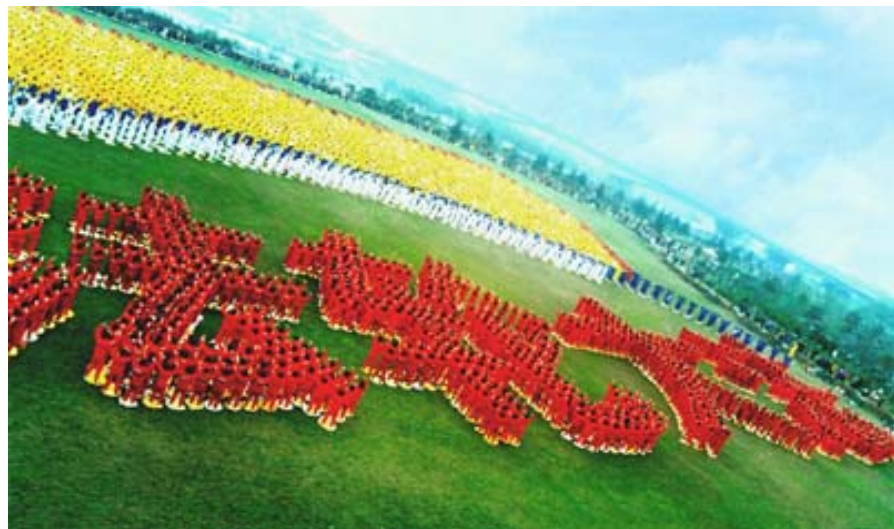
■ 气势磅礴的排字炼功——法轮大法,湖北武汉(1999-3-1)

1992 年至 1999 年七年间, 法轮功以人传人、心传心的方式迅速传遍神州大地。据 98 年底中国政府的一项统计显示, 全国学炼法轮功者超过七千万。无论城市乡村, 街头巷尾, 都能看到法轮功学员的炼功的宏大场面。大法洪传之处人心向善, 道德回升, 民体康健, 国泰民安。许多报纸, 电视台也对法轮功做过客观的报导。