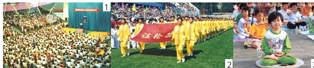
图 3/ 广州法轮功小弟子修炼心得交流会时, 小弟子集体炼功。(1998)