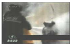
2、击打后飞出的重击