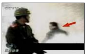
4、击打者仍保持用力姿势