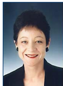
欧洲议会人权委员会副主席，英国女勋爵莎拉·拉德福德女士

近期，欧洲议会人权委员会副主席、英国女勋爵莎拉·拉德福德女士在接受专访时表示，让她吃惊的不是中共的行为，而是欧洲公司在自己