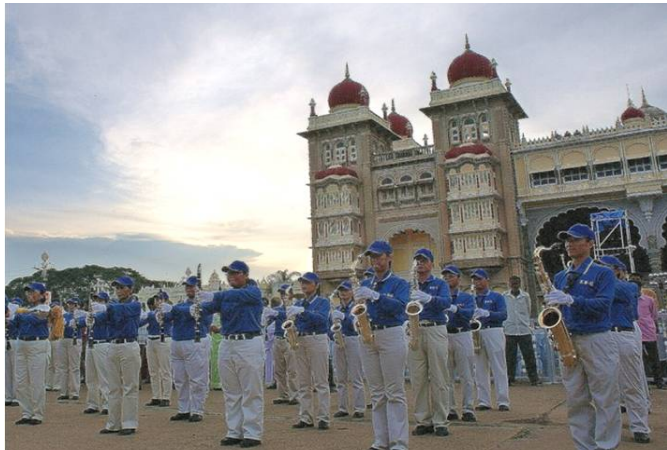
亚太天国乐团在迈索尔王宫前表演

二零零八年十月七日，法轮大法亚太天国乐团首次受邀到印度迈索尔城市（Mysore），为每年一度的重要节庆达瑟拉节（Dasara）演奏，顿时成为焦点。乐团不但吸引多家媒体争相报导，同时也现场直播到全国各地。印度政府的国防部长也亲临现场与迈索尔市长一起观看天国乐团的演出。