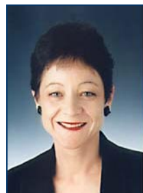
欧洲议会人权委员会副主席，英国女勋爵莎拉·拉德福德女士

近期，欧洲议会人权委员会副主席、英国女勋爵莎拉·拉德福德女士在接受专访时表示，让她吃惊的不是中共的行为，而是欧洲公司在自己