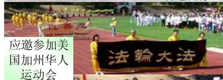
应邀参加美国加州华人运动会