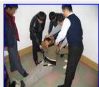
九台饮马河劳教所酷刑：电棍插裤裆电击阴部