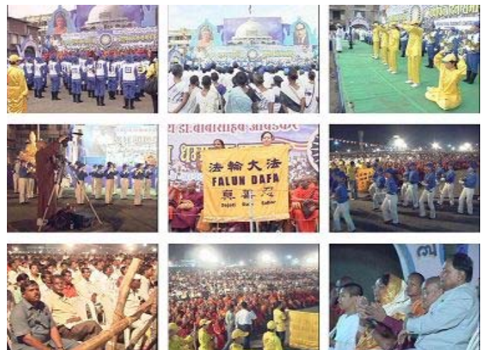
天国乐团十月七日至十日在印度演出，民众热烈欢迎

轮功。参加印度之行回来的天国乐团团员分享心得说：「这一趟心里很触动，那几天，真的是人山人海，一望无际都是人，每个团员都拼命的吹奏，就算吹奏的很累，甚至嘴都破了，可是大家看到热情的群众，不间断的继续吹奏。从早吹到晚，从晚吹到早。」