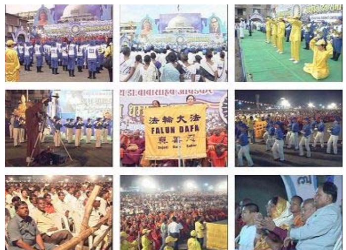
天国乐团十月七日至十日在印度演出，民众热烈欢迎

轮功。参加印度之行回来的天国乐团团员分享心得说：「这一趟心里很触动，那几天，真的是人山人海，一望无际都是人，每个团员都拼命的吹奏，就算吹奏的很累，甚至嘴都破了，可是大家看到热情的群众，不间断的继续吹奏。从早吹到晚，从晚吹到早。」