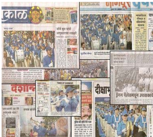
媒体争相报道法轮功

注：天国乐团分布于全球七大洲，美国、加拿大、澳大利亚、新西兰、韩国、台湾、日本、马来西亚、新加坡和欧洲国家等地。乐队团员都是以「真、善、忍」为准则的法轮功修炼者。