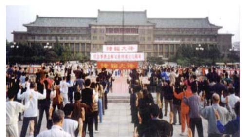
▲长春法轮功学员集体炼功

和瑞典传功讲法，开始了法轮大法在海外的传播，也使各国人民有机会了解中华古老文化，给中国