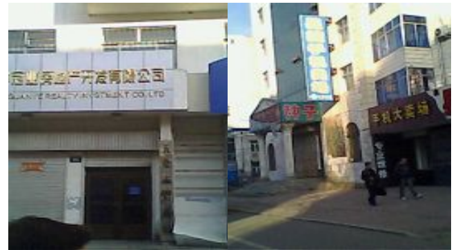
审计局二楼洗脑班