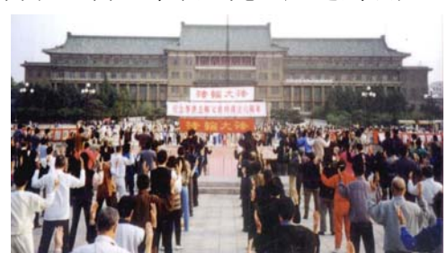
▲长春法轮功学员集体炼功

和瑞典传功讲法，开始了法轮大法在海外的传播，也使各国人民有机会了解中华古老文化，给中国