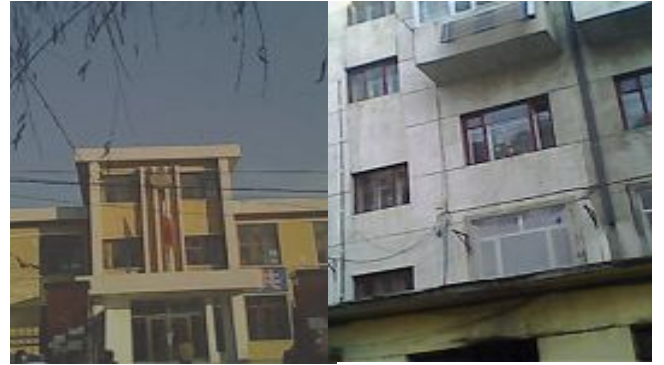
五常六一零现位于招商局二楼