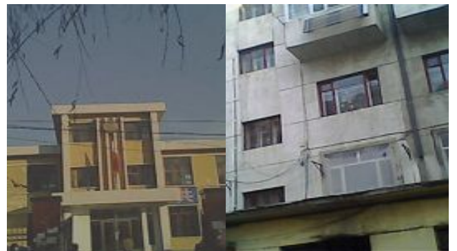
五常六一零现位于招商局二楼