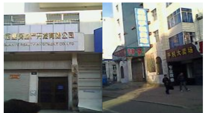
审计局二楼洗脑班