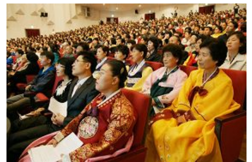
法轮功学员聆听同修心得交流

一千五百多位法轮功学员代表参加了当天的盛会。十六位学员做了现场发言，讲述了他们的修炼体会。