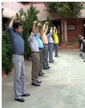
学校老师 在队伍前排示范

这些学校多数在体育课中炼法轮功，有些纯真的小朋友在炼功中天目自然打开，将看到的另外空间的林林总总，告知校长、老师，让师长们更加有信心，师长们身心也逐渐变好，因此师生将体育课改为炼功。