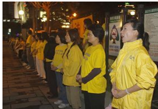
法轮功学员在101大楼外高喊「法轮大法好」、「停止迫害法轮功」

达台北101大楼，由海峡交流基金会董事长江丙坤陪同。在车队进入101大楼时，101旁的信义广场聚集二百至三百名法轮功学员炼功，