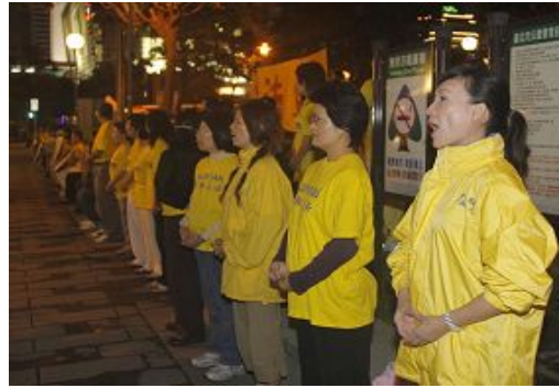
法轮功学员在101大楼外高喊「法轮大法好」、「停止迫害法轮功」

达台北101大楼，由海峡交流基金会董事长江丙坤陪同。在车队进入101大楼时，101旁的信义广场聚集二百至三百名法轮功学员炼功，