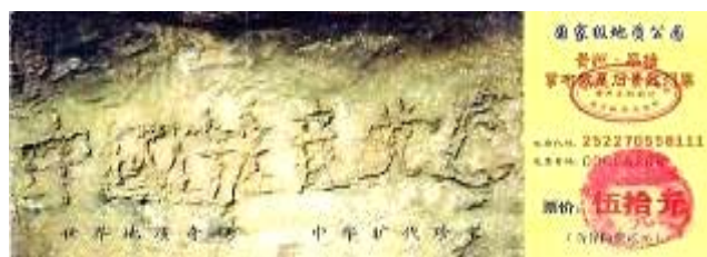
贵州省平塘县掌布乡风景区门票