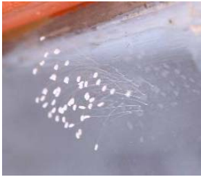
雄县百姓家玻璃上 盛开的优昙婆罗花

自 2007 年 12 月至今在保定市区及雄县龙湾村、咎岗、邢村、三铺村百姓家相继发现盛开的优昙婆罗花。前去观看的人无不称奇。其中龙湾村花开的事实雄县电视台也已报导，报导称为奇花。雪白花朵直径约有 1 毫米，花形如钟，淡白色，有光晕，花茎细如金丝、有韧劲；均现一根、一茎、一花之玉体。这些优昙婆罗花有的开在门窗玻璃上，有的开在檩桷上，有的开在瓷砖上。近日在保定市高开区发现的是开在一棵月季花的叶子上，不畏严寒，长期绽放不谢。所见之人无不称奇。