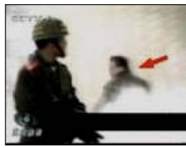
3、手摸被打后的头部 4、击打者仍保持用力姿势

真实揭露了自焚骗局的纪录片《伪火》，获第五十一届哥伦布国际电影电视节荣誉奖。国际教育发展组织于 2001 年 8 月在联合国会议上发表正式声明：“中共当局企图以自焚事件诬陷法轮功，而我们得到的录像分析表明，整个事件是中共当局一手导演的。”