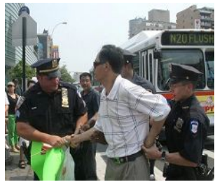
美国警察逮捕谩骂法轮功学员的中共暴徒。

从国内到海外配合式构陷法轮功，继续制造谎言煽动中国民众和海外华人对法轮功的仇恨。在中领馆的幕后组织下，五月十七日，暴徒大规模骚扰和围攻纽约退党服务中心，并殴打退党服务中心员工。并在此后数