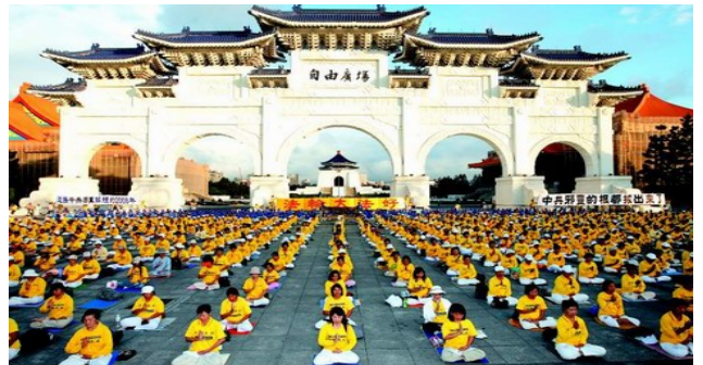
二零零八年十一月四日，三千多名台湾法轮功学员在台北自由广场前炼功，抗议中共迫害法轮功。

而法轮功则相反，没有政治纲领、没有政治目标，没有组织形式，想炼就炼，不想炼就不炼。要求弟子崇尚佛法，内心自省，按“真善忍”的要求去修行，在健身的同时提高道德修养，心灵升华，与人为善，珍爱生命、不杀生（“天安门自焚”事件是新闻造假，漏洞很多，早已成为国际社会的笑谈了。）等等。