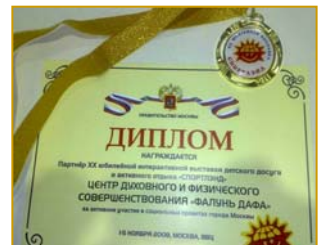
法轮大法得到人们的一致好评，荣获莫斯科市政府颁发的奖状和奖章。

很多观众边看边跟着学炼。人们争相索要大法真相资料，不少人在签名簿上签名，支持法轮大法，反对中共迫害。“法轮大法好！法轮大法了不起！”是明白真相后人们对法轮大法和大法弟子的评价。◇