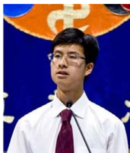
图 本文作者胡先生在2008年美国西部法轮功修炼交流会上发言。本文节选自胡先生发言稿。