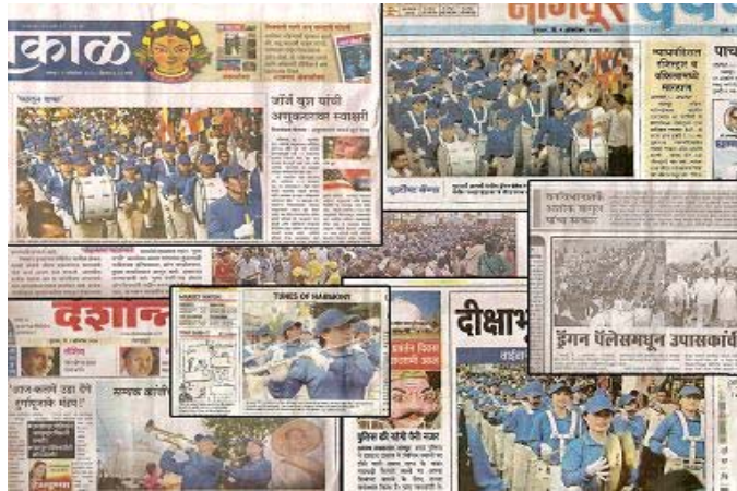
▲天国乐团于十月七日至十日在印度演出，媒体争相报道。

注：天国乐团分布于美国、加拿大、澳大利亚、新西兰、韩国、台湾、日本、马来西亚、新加坡和欧洲国家等地。乐队团员都是以「真、善、忍」为准则的法轮功修炼者。