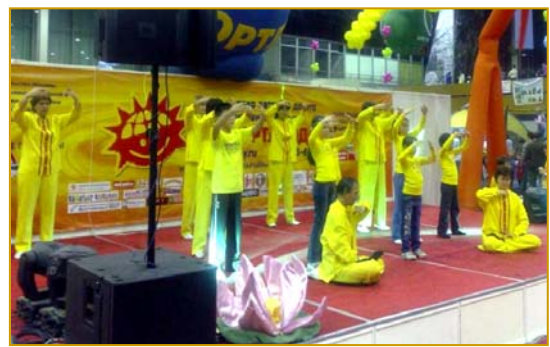
俄罗斯法轮功学员在博览会上演示五套功法

【明慧网】最近一段时间，人们最关心的莫过于毒奶粉事件了，继三鹿被查出含有毒化学品后，蒙牛、伊利、光明等二十余家的奶制品中都被查出含有三聚氰胺，不仅是儿童奶粉有毒，成年奶粉含毒量超过婴儿奶粉的双倍，这是一个多么触目惊心