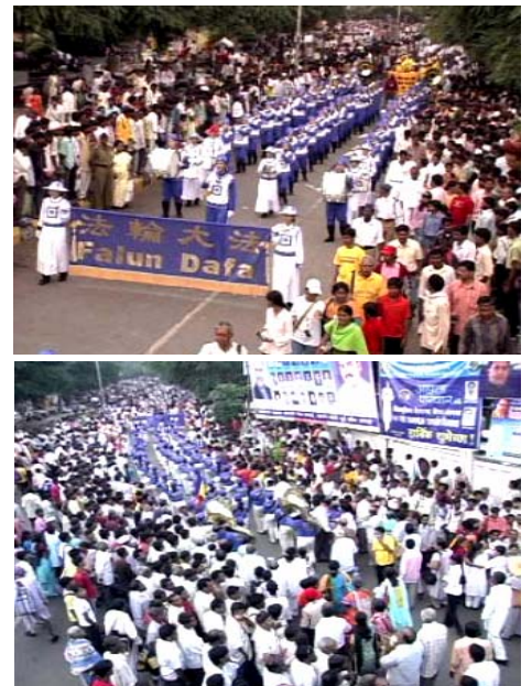
▲亚太天国乐团在印度迈索尔演出，受到民众热烈欢迎。

【明慧网】二零零八年十月七日，由台湾、马来西亚和新加坡法轮功学员所组成的亚太天国乐团受邀到印度迈索尔城市，为每年一度的重要节庆达瑟拉节演奏。有四、五十万群众和各国和尚、喇嘛聚集在这里，是难得的佛教庆典。天国乐