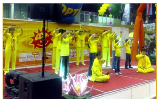
俄罗斯法轮功学员在博览会上演示五套功法