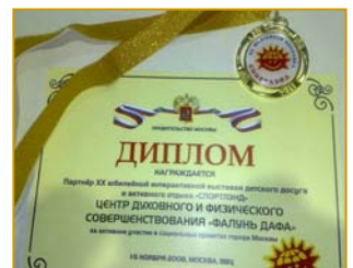
法轮大法得到人们的一致好评，荣获莫斯科市政府颁发的奖状和奖章。

很多观众边看边跟着学炼。人们争相索要大法真相资料，不少人在签名簿上签名，支持法轮大法，反对中共迫害。“法轮大法好！法轮大法了不起！”是明白真相后人们对法轮大法和大法弟子的评价。◇