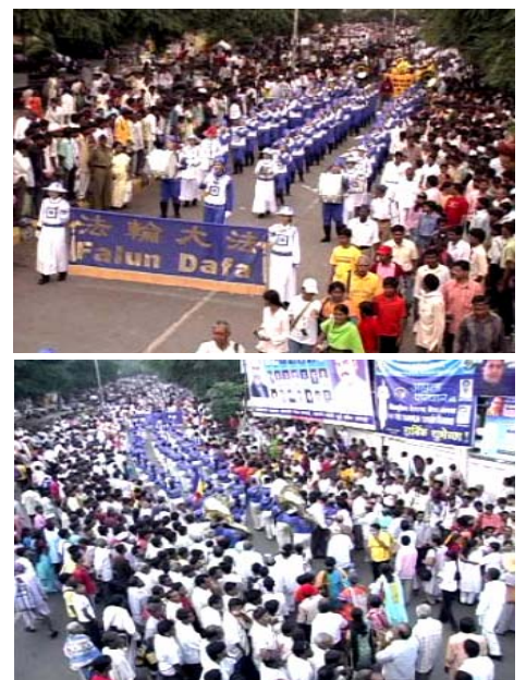
▲亚太天国乐团在印度迈索尔演出，受到民众热烈欢迎。

【明慧网】二零零八年十月七日，由台湾、马来西亚和新加坡法轮功学员所组成的亚太天国乐团受邀到印度迈索尔城市，为每年一度的重要节庆达瑟拉节演奏。有四、五十万群众和各国和尚、喇嘛聚集在这里，是难得的佛教庆典。天国乐