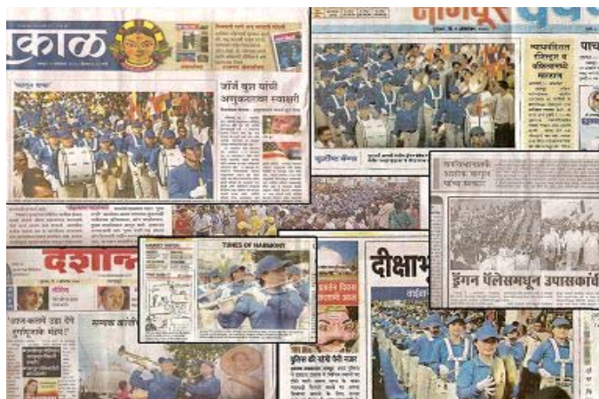
▲天国乐团于十月七日至十日在印度演出，媒体争相报道。

注：天国乐团分布于美国、加拿大、澳大利亚、新西兰、韩国、台湾、日本、马来西亚、新加坡和欧洲国家等地。乐队团员都是以「真、善、忍」为准则的法轮功修炼者。