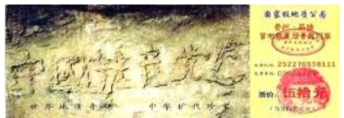
贵州省平塘县掌布乡风景区门票