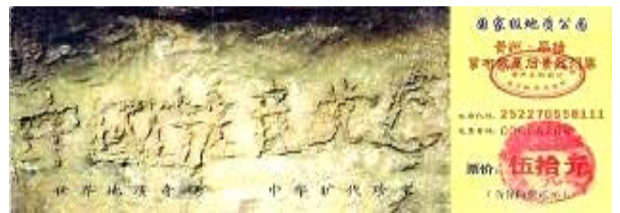
贵州省平塘县掌布乡风景区门票