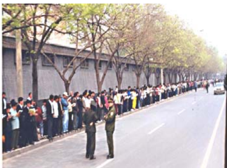
两警察在聊天和维持次序

早在 1996 年，把持政法、公安部门的罗干就开始刁难法轮功。因为修炼法轮功的人多，而且传播很快，江泽民出于嫉妒和恐惧，认为法轮功在