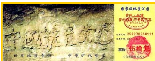
图：贵州平塘县掌布乡风景区门票

2002 年贵州平塘县掌布乡发现了有 2.7 亿年的“藏字石”，五百年前崩裂的巨石断面内惊现六个排列整齐的大字“中国共产党”，经中国科学文化考察团专家们深入实地考察后，认定为天然形成。如果冥冥之中真的一切早有安排，相信您一定不会错过这转瞬即逝的机缘。请您为了自己生命的永远考虑，把“三退”（退党、退团、退队）当作一次免费的平安保险吧。