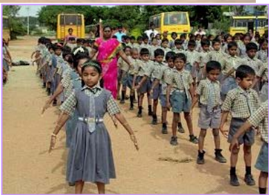
右图：学校学生集体炼法轮功

等对法轮大法和创始人的褒奖、支持议案和信函已近 3000 项。创始人李洪志先生自 2000 年起连续四年被提名为诺贝尔和平奖候选人。◇