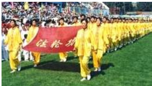
法轮功学员在亚洲体育节开幕式上列队入场。(沈阳, 1998)

◆一九九八年五月十五日晚十时，中央电视台在第一套节目《晚间新闻》和第五套节目中分别报道