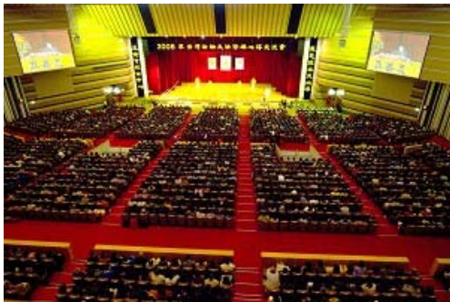
零八年十二月十四日，台湾八千名法轮大法学员举行年度心得交流会