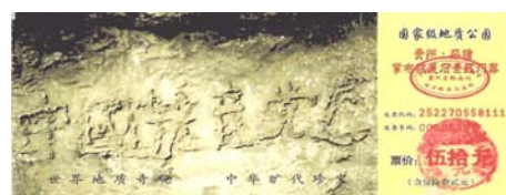
贵州奇石天然形成六个大字“中国共产党亡” 图为风景区门票

文革时跟着邪党砸佛像的人都在尝受恶果。今天有多少人又被邪党蒙蔽重蹈覆辙，诽谤大法，迫害法轮功学员。你可知道，这是拉你下地狱的事呀，快一点猛醒吧！