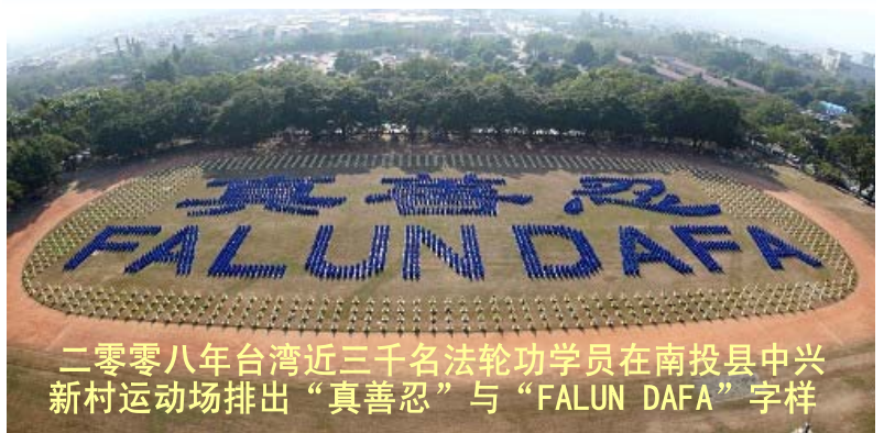
二零零八年台湾近三千名法轮功学员在南投县中兴新村运动场排出“真善忍”与“FALUN DAFA”字样