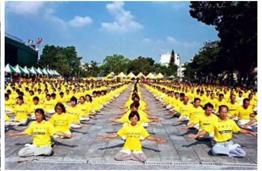
法轮功成为台南市体育节的焦点 法轮功学员集体炼功场面