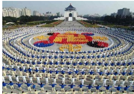
二零零五年十二月二十五日，四千名学员排组法轮图形