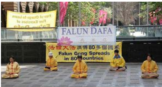
法轮功学员演示功法

【明慧网二零零八年十月十四日】(明慧记者蕴韵悉尼采访报导)二零零八年十月十三日,法轮功学员在澳洲悉尼市中心马丁广场举办洪法活动,演示功法、散发真相传单、征集签名,向民众展示法轮功的美好,揭露九年来中共对法轮功修炼者的邪恶迫害,呼吁世人共同制止迫害。