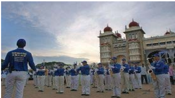
亚太天国乐团受邀到迈索尔皇宫前表演

大法、对大法弟子的一个善念就能定下自己未来。记住“法轮大法好”、“真善忍好”吧，这是救命的真言！赶快脱离中共邪党吧，不要在天灭中共时为它作陪葬！