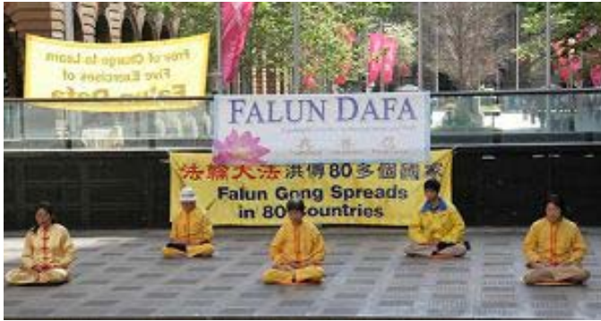
法轮功学员演示功法

【明慧网二零零八年十月十四日】(明慧记者蕴韵悉尼采访报导)二零零八年十月十三日,法轮功学员在澳洲悉尼市中心马丁广场举办洪法活动,演示功法、散发真相传单、征集签名,向民众展示法轮功的美好,揭露九年来中共对法轮功修炼者的邪恶迫害,呼吁世人共同制止迫害。