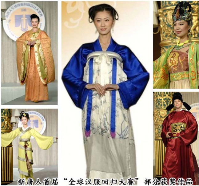
新唐人首届“全球汉服回归大赛”部分获奖作品

【明慧网】二零零八年十月十九日，首届新唐人汉服回归大奖赛在世界时装之都的曼哈顿乔治王