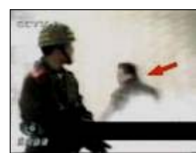
4、击打者仍保持用力姿

真实揭露了自焚骗局的纪录片《伪火》，获第五十一届哥伦布国际电影电视节荣誉奖。国际教育发展组织于 2001 年 8 月在联合国会议上发表正式声