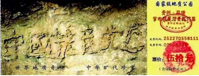
图为藏字石风景区门票：“中国共产党亡”清晰可见六个横排大字。据专家考证“藏字石”形成于两亿多年前，绝无任何人工雕琢、塑造、粘贴的痕迹。

二零零二年六月“藏字石”在贵州省平塘县浪马寨被发现，巨石上清晰可见“中国共产党亡”