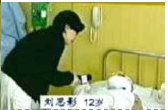
气管切开还能说唱？记者采访不穿防护服不戴口罩。

不就是邪党通过电视、广播、报纸给你灌的吗？其实我们用自己的思想理性的去分析所谓的天安门“自焚”，就会发现多处漏洞。