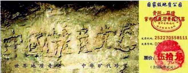
图为藏字石风景区门票：“中国共产党亡”清晰可见六个横排大字。据专家考证“藏字石”形成于两亿多年前，绝无任何人工雕琢、塑造、粘贴的痕迹。

二零零二年六月“藏字石”在贵州省平塘县浪马寨被发现，巨石上清晰可见“中国共产党亡”