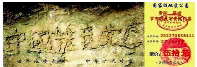
图为藏字石风景区门票：“中国共产党亡”清晰可见

贵州平塘的那块天然“亡共石”，为什么早不发现迟不发现，偏偏在 2002 年发现？这就是在告诉世人：中共灭亡，就在近期！