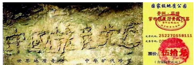
图为藏字石风景区门票：“中国共产党亡”清晰可见

贵州平塘的那块天然“亡共石”，为什么早不发现迟不发现，偏偏在 2002 年发现？这就是在告诉世人：中共灭亡，就在近期！