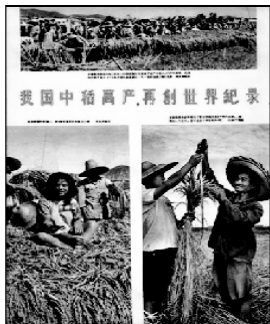
图：1959年《大跃进》期间中共官方大幅报导『我国中稻高产，再创世界记录』，声称『在早稻亩产36000斤的基础上，中稻亩产达到46000斤。』据吉尼斯世界记录大全记载，世界上最惨重的大饥荒发生在1959年到1961年的中国，约有四千万人死亡。由于中共浮夸风和隐瞒欺骗，在1959年初粮食耗尽，民众陆续饿死之时，中共官员仍严刑收缴『被隐藏的余粮』，造成大量民众被刑囚而死。

共产邪党说法轮大法是邪教，反人类，什么是衡量好坏的标准呢？难道符合了政府中某些人的利益就是正的，不符合可以定为邪的吗，或者是，不是“共产”以内的思想都是邪的呢？正与邪，不是某个人说了算的，我们中国古老的文化传统中早有对善与恶的阐述，法轮大法中讲“真，善，忍是衡量好坏人的唯一标准”。