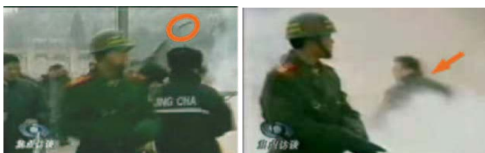
3、重物飞越人头顶 4、打击者仍保持用力姿势