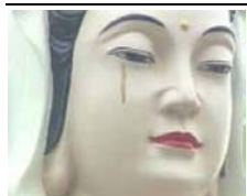
流泪的观音像， 台湾高雄

希望还在行恶者通过这些事例能够警醒，正视自己的危险处境，不再为中共邪党卖命，不再参与迫害，为自己和家人的未来负责！