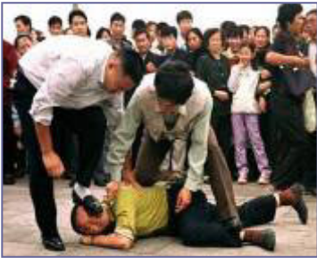
天安门便衣警察毒打上访、说明真相的法轮功学员