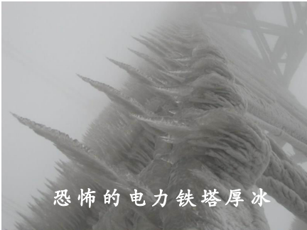
恐怖的电力铁塔厚冰

当我们看着困在路上、车站的司机、旅客，还有房屋倒塌、停电断水的灾民，有没有想过，风调雨顺、国泰民安究竟从何而来？从遵循天理良心中来，从与天地、自然的和谐相处中来。我们究竟做的怎样？中共又做的怎样？中共能做到吗？中共能让我们做到吗？