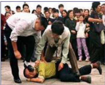
天安门便衣警察毒打上访、说明真相的法轮功学员