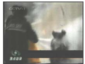
2、击打后飞出的重物