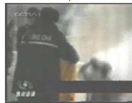
3、手摸被打后的头部