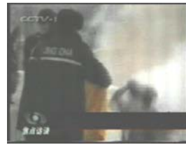
3、手摸被打后的头部