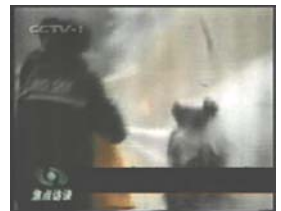
2、击打后飞出的重物